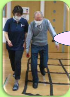
ふまねっと歩行訓練