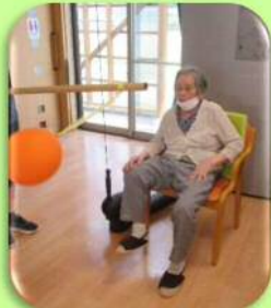
風船めがけて足上げ