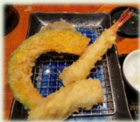
揚げたての天ぷら