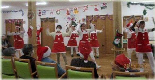
あわてんぼうのサンタクロース を披露