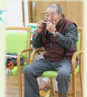
ハーモニカのボランティア