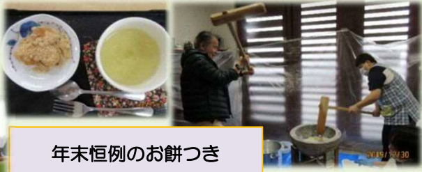
年末恒例のお餅つき