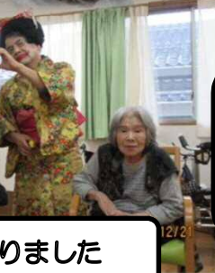
さわって さわって なんじゃろ うねえ？