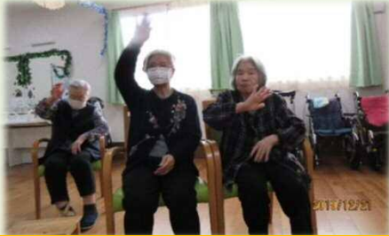
利用者の方も踊られます♪