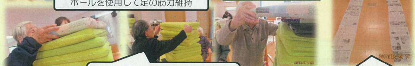
立位安定を意図した 「座布団積みレク」