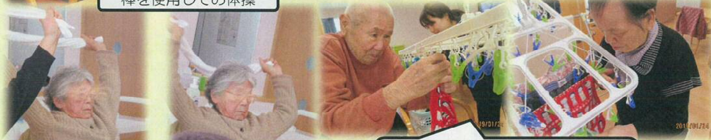
指先と日常生活での運動 「ランドリーレク」