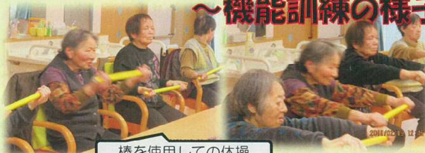
棒を使用しての体操

お一人お一人の生活上の目標をお聞きし「それぞれのメニュー」に取り組んでいただいています。