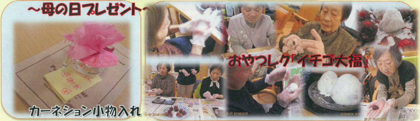
カーネーション小物入れ