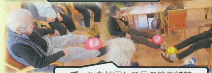
ボールを使用して足の筋力維持