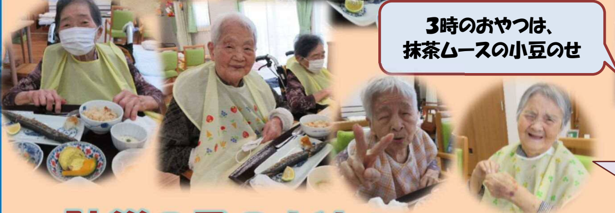
3時のおやつは、 抹茶ムースの小豆のせ