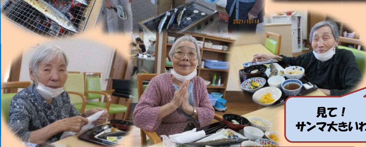
見て！ サンマ大きいわ