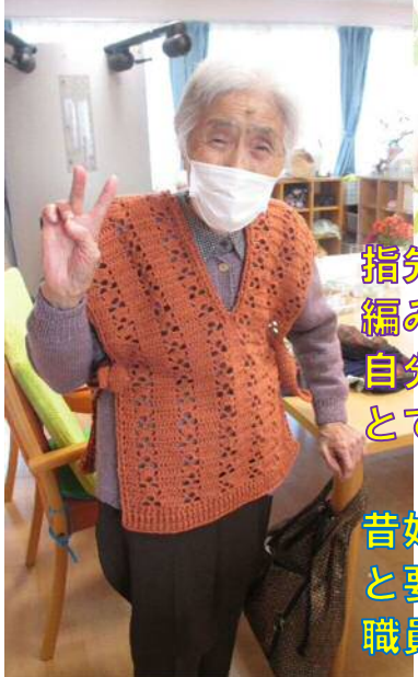
指先がとても器用で 編み物がとても上手です。 自分の意見もしっかり持ち とてもいい作品が出来ました。