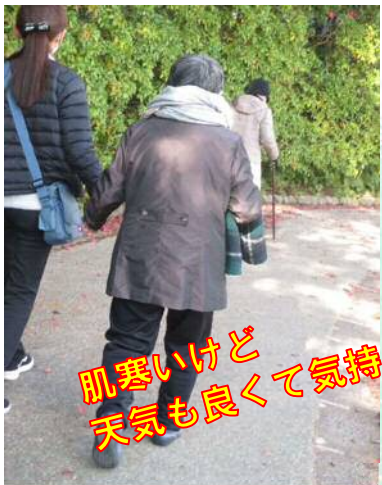
肌寒いけど 天気も良くて気持ちがいいね～！！