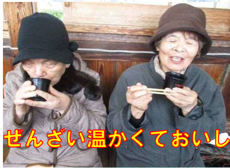
ぜんざい温かくておいしいね～