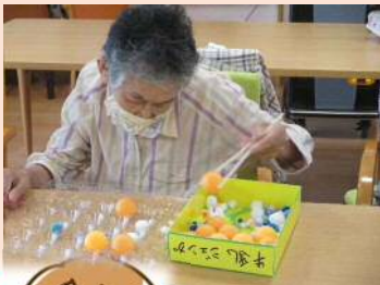
箸を使い挟む、つまむ動作