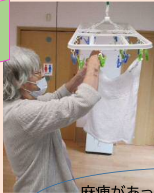
麻痺があっても工夫しながら取り組んでいます