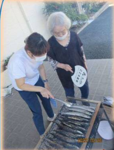
和気あいあいと さんま焼いとります