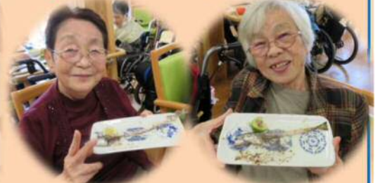
早く食べないと なくなるよ