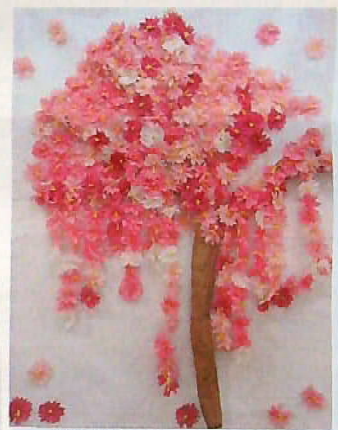
壁画制作で桜の木を作りました。